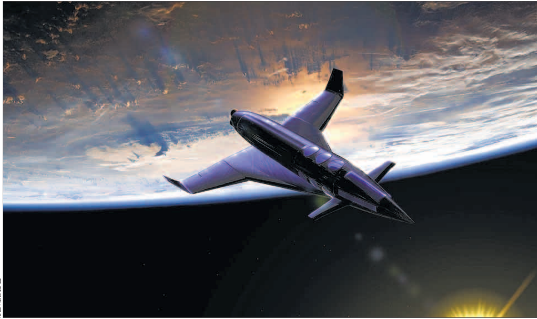
Das Raketenflugzeug „Enterprise“ mit den markanten Entenflügeln erreicht eine Flughöhe von 110 Kilometern. Es bietet maximal sechs Passagieren und einem Piloten Platz

HOLZMINDEN – Bei Motorradkontrollen im Landkreis Holzminden hat die Polizei 20 Extrem-Raser aus dem Verkehr gezogen. Sie waren mit ihren Motorrädern so schnell unterwegs, dass sie den Führerschein für einen bis drei Monate abgeben müssen. Den Negativ-Rekord habe dabei ein 20-Jähriger aufgestellt, teilte ein Sprecher am Dienstag mit. Der Mann war mit 184 Stundenkilometern durch einen Tempo-70-Bereich auf einer schmalen Landstraße gerast. Ihm drohen neben dem dreimonatigen Fahrverbot auch 600 Euro Bußgeld. Bei den mehrtägigen Kontrollen stellten die Beamten insgesamt 424 Verkehrsverstöße durch motorisierte Zweiradfahrer fest. lni